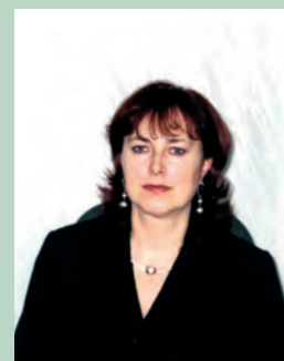
Kierownik Działu Realizacji Pomocy Publicznej

– PFRON wychodzi z różnymi programami – adresowanymi zarówno do instytucji i organizacji pozarządowych jak też bezpośrednio do osób indywidualnych – których celem