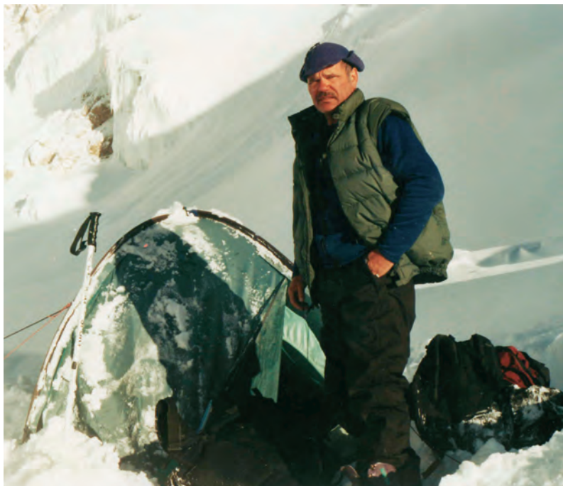
Obóz pod Pikiem Lenina

– Tym razem nie miałem szczęścia – śmieje się – bo nie opacznie dołączyłem do grupy ludzi, którzy zupełnie nie znali się na organizowaniu wypraw. Chodziło im tylko o to, by zgar-