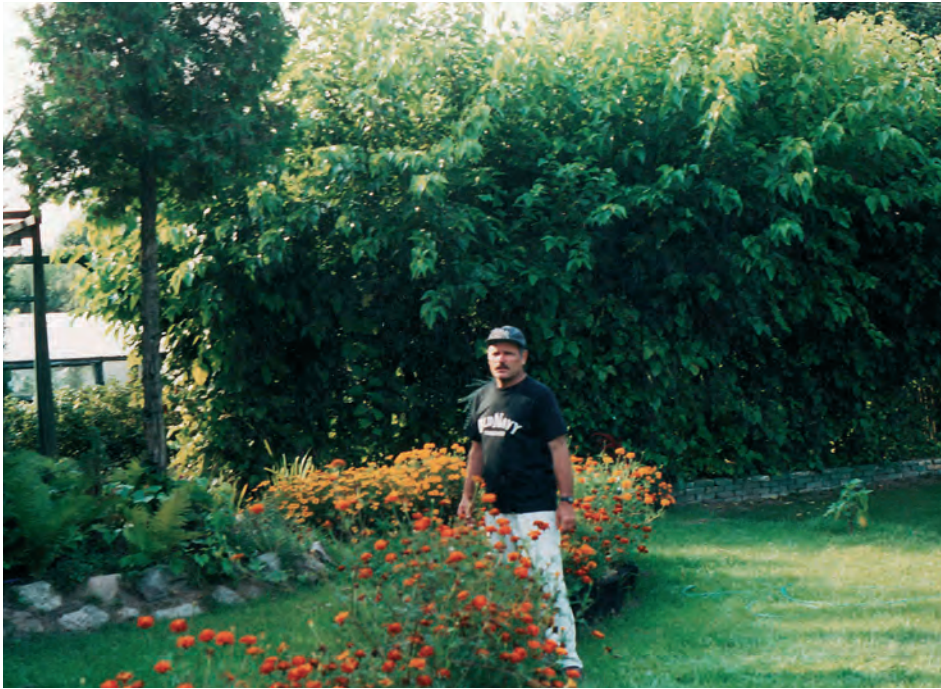
W swoim ogrodzie w Halickich pod Białymstokiem

mu miecz samurajski, łącznie z pochwą i ozdobami. Wykonał już sześć, z samochodowych resorów. Każdy kosztował trzy-cztery tygodnie roboty. Syn zabrał cztery. Oceniał, że lepsze od kupowanych.